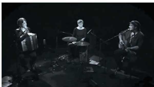
Concert des Troubadours du 17